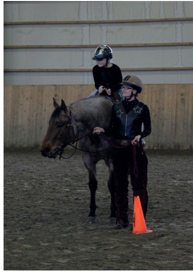
Yhteiset kisareissut antoivat paljon.