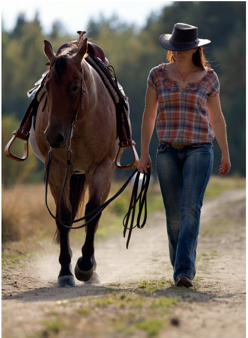
Yhteistyö hevosen kanssa on kuin terapiaa, yhdessäoloa joka parhaimmillaan hoitaa sielua. On helpompi jatkaa arkea tallireissun jälkeen.