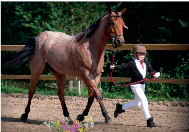
Match Show Kannus, Leone voitti Junior Handler-luokan.