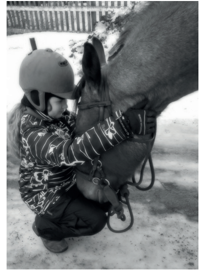
Friends forever <3