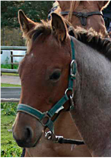
HH Mr Magic Wininic, nuo silmät!